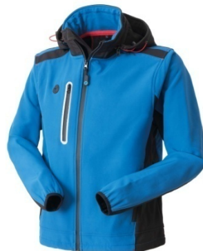
06 – AZZURRO ROYAL