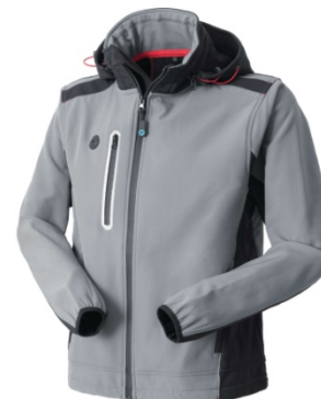
12 – GRIGIO