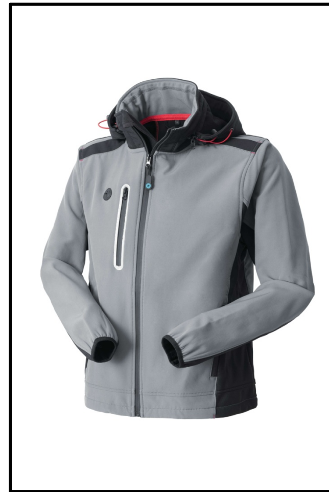
12 – GRIGIO