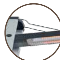
gancio di fissaggio